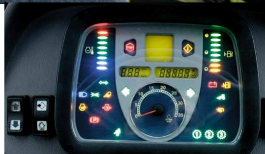
TABLEAU DE BORD ANALOGIQUE ET DIGITAL

L'inverseur sous charge au volant procure des